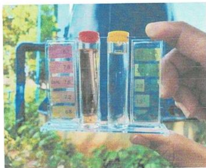
หมู่ที่ ๔