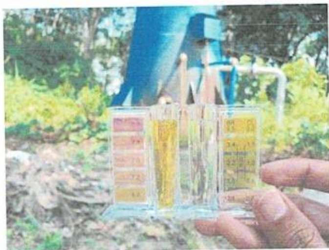
หมู่ที่ ๑