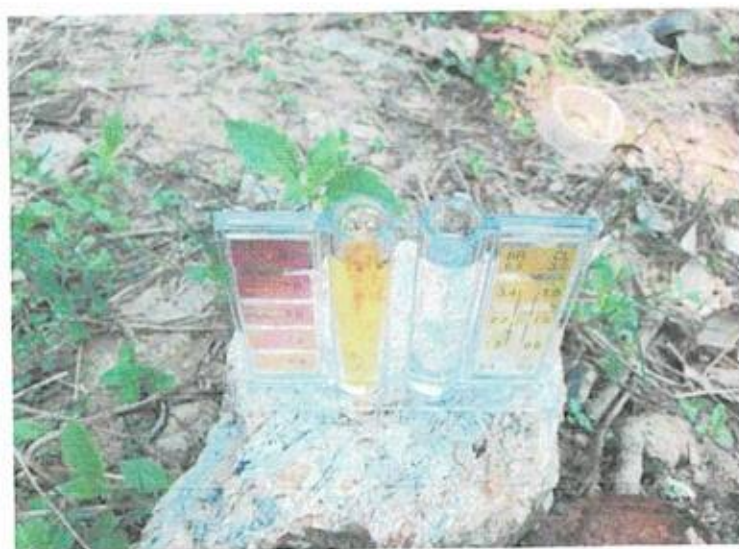
หมู่ที่ ๕