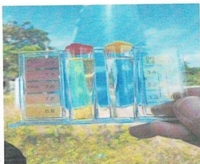
หมู่ที่ ๓