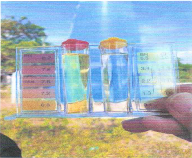
หมู่ที่ ๓