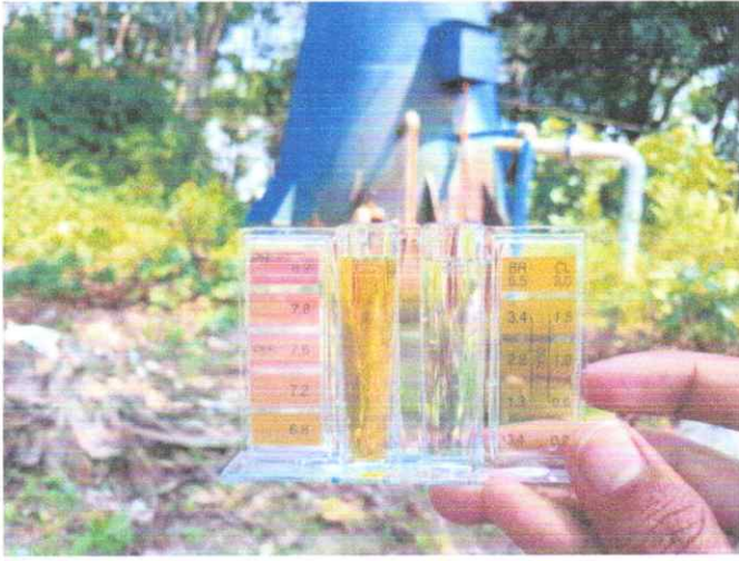
หมู่ที่ ๑