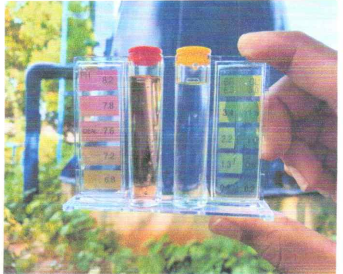
หมู่ที่ ๔